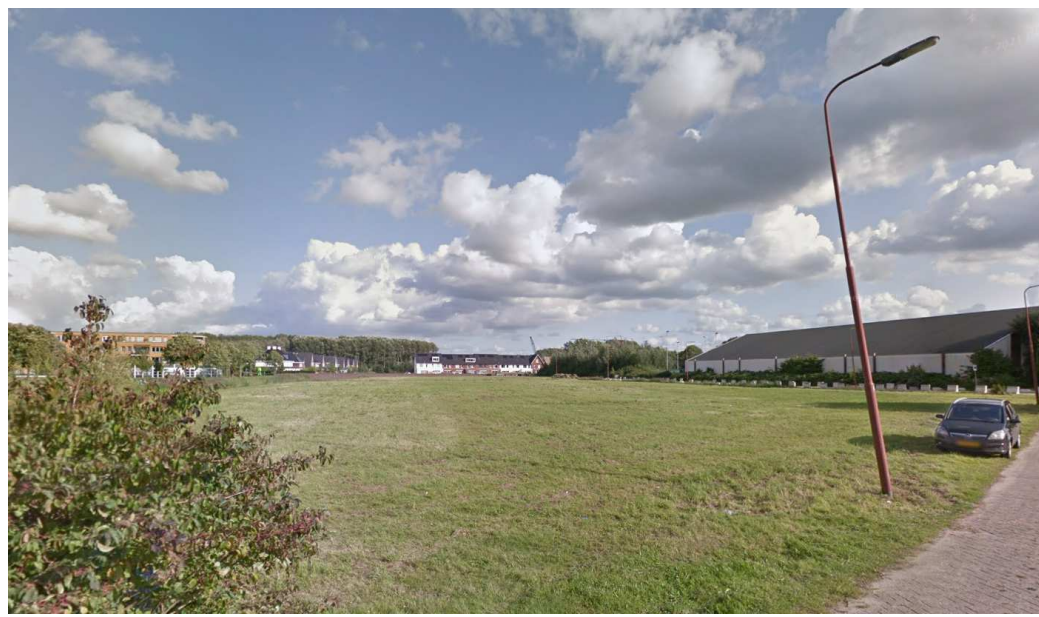
Foto bestaande situatie - rechts achter