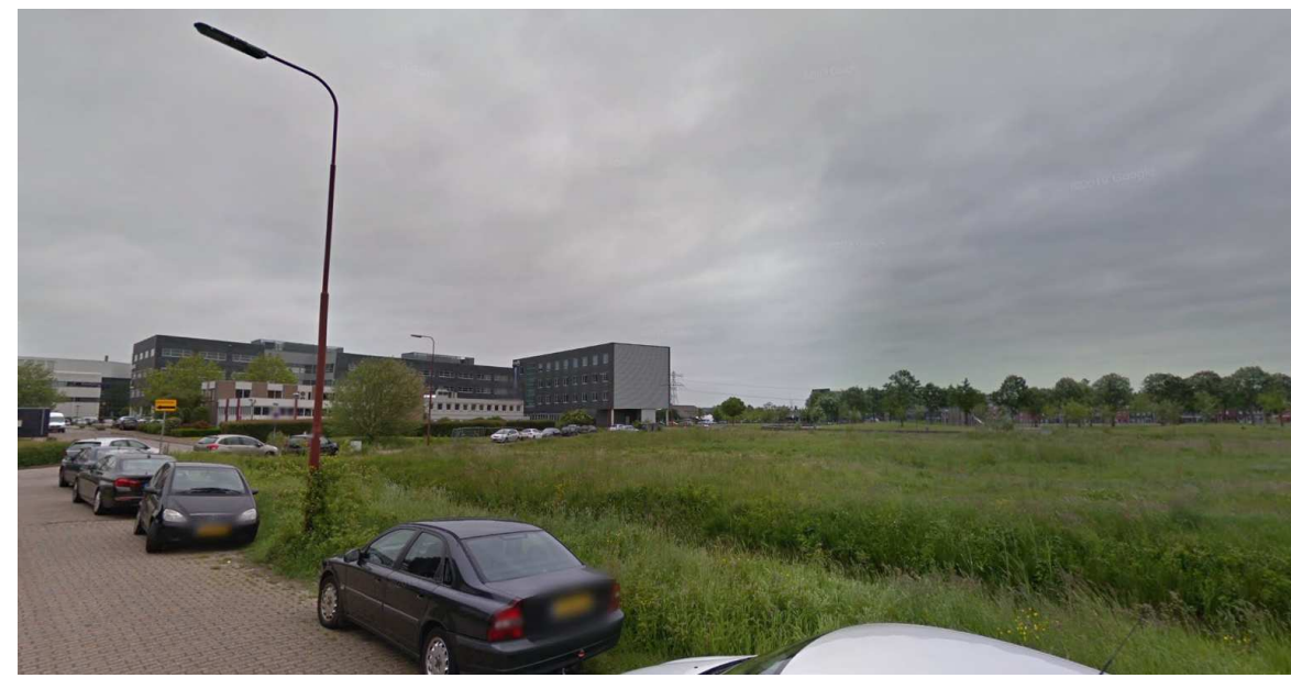
Foto bestaande situatie - links voor