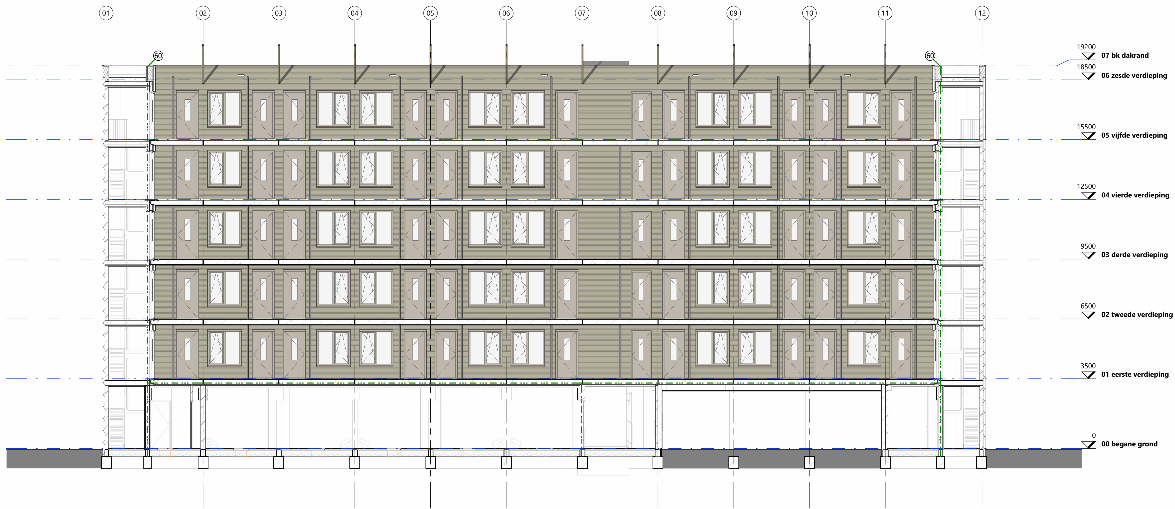
achtergevel - galerij