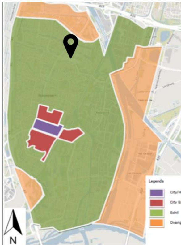
Figuur 3.1: Gebiedsindeling parkeernormen