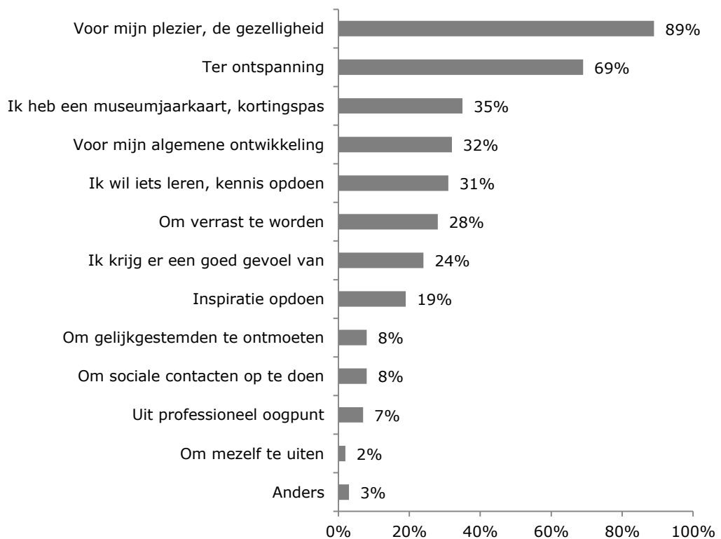
Figuur 2: Waarom bezoekt u culturele activiteiten of instellingen? (n = 475)

Het aantal panelleden dat de categorie anders, namelijk invulde is te klein om er hier iets over te kunnen zeggen.